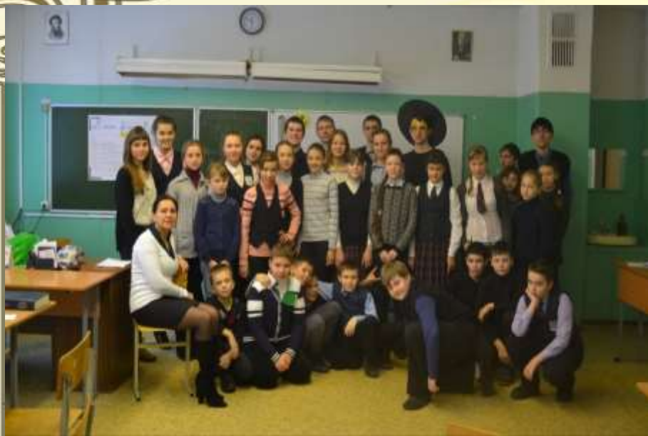
КВН «Путешествие в страну Лингвинию»